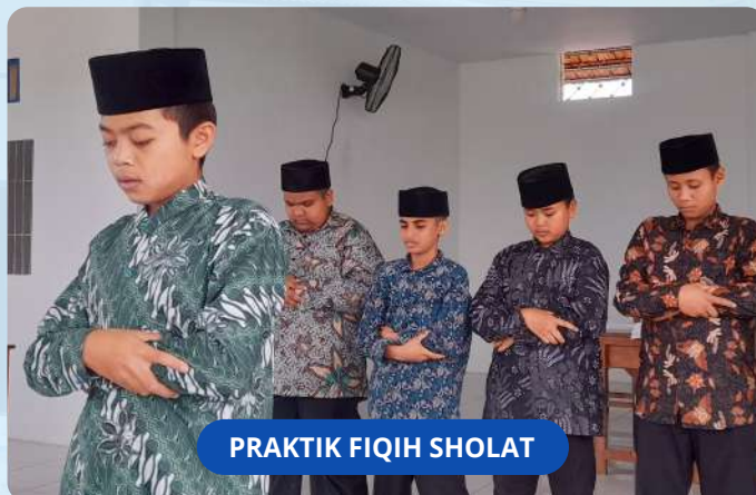
PRAKTIK FIQH SHOLAT