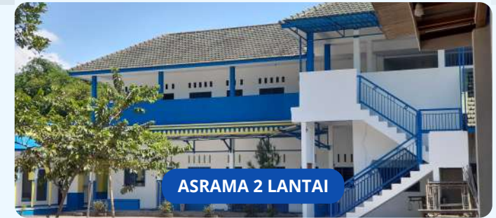
ASRAMA 2 LANTAI