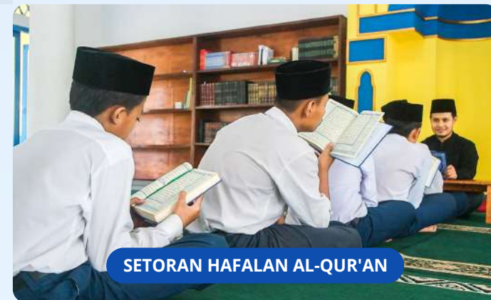
SETORAN HAFALAN AL-QUR'AN